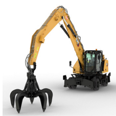
MANIPULADORAS DE MATERIALES