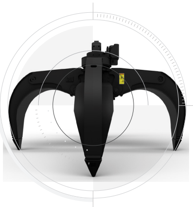
GSH – GARRAS DE CÁSCARA DE NARANJA