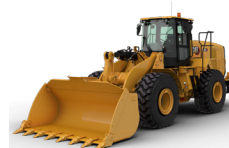
CARGADORAS DE RUEDAS