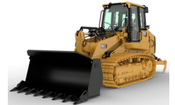
CARGADORAS DE CADENAS